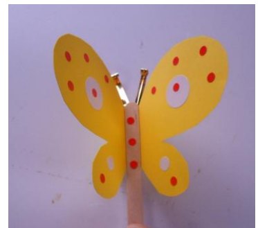
♪パタパタちょうちょ♪